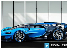
Bugatti Chiron auto más rápido