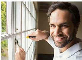
Ahorre en ventanas

Qué hay que hacer si nos paran en un control de la Guardia Civil